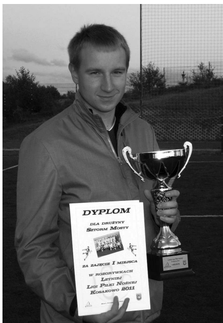
Sztorm Mosty - 1 miejsce