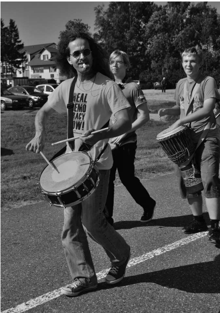
Uczestnicy dożynek w Kosakowie

-Kruszczak. Głównymi sponsorami dożynek byli: Bank Rumia oraz Pro-Internet. Świetnej zabawie i prawdziwie niezapomnianej atmosferze nie przeszkodziła nawet szalejąca przez moment burza.