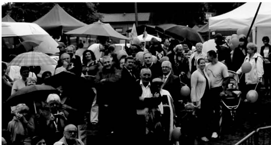
Uczestnicy XV Festynu Kaszubskiego

Wszyscy byli zachwyceni wokalistą. Po koncercie był czas na autografy dla fanów oraz wpis do naszej kroniki. Następnie na scenie pojawił się zespół Dual, a po godzinie 21 był pokaz fajerwerków, jako podziękowanie od Zrzeszenia z Dębogórze dla wszystkich zgromadzonych. Niebo rozświetliło się setkami wielokolorowych gwiazd, gwiazdeczek i palm.