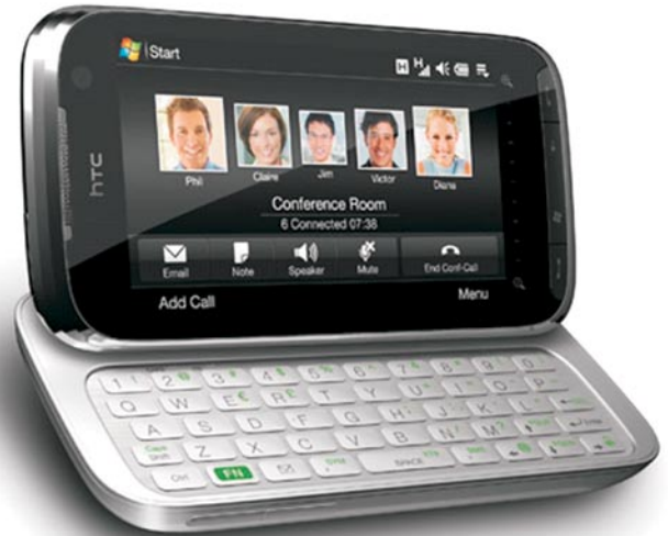
Przenośny terminal, jaki będzie wykorzystywany przez rachmistrzów podczas

w terminale mobilne oraz ankieterów statystycznych. Wszystkie informacje zebrane podczas spisu są prawnie chronione w ramach tajemnicy statystycznej. Dane zebrane w spisie zostaną odpersonalizowane. Będą mogły zostać wykorzystane jedynie do opracowań, zestawień oraz analiz statystycznych.